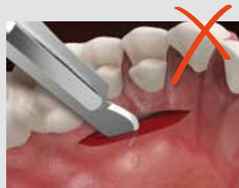
Geistlich Mucograft® permet d'éviter le prélèvement de tissus mous au palais.