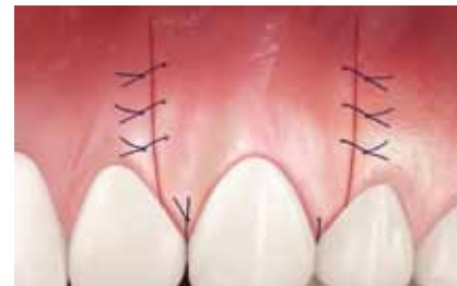
Suture de la lésion.