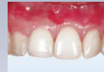
Résultat à 6 mois après traitement avec Geistlich Mucograft® (Dr N. Braz de Oliveira).