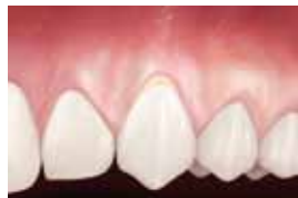
Récession gingivale modérée

L'os et la gencive autour de la dent peuvent continuer à reculer