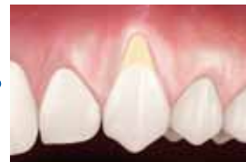
Situation probable sans traitement