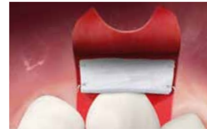
Pose de Geistlich Mucograft® sur la zone concernée.