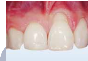
Récession gingivale avant traitement (Dr N. Braz de Oliveira).

Moins de douleur, et retour à la normale plus rapide après l'intervention