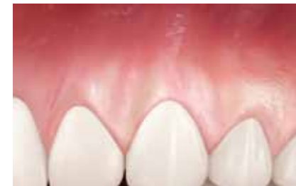
Résultat du traitement de la récession (les résultats peuvent varier).

IMPORTANT : Il est essentiel d'identifier la cause de la récession gingivale avant le traitement chirurgical. Votre praticien saura vous conseiller sur les mesures convenant à votre problème.