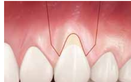
Approche chirurgicale pour le traitement d'une récession gingivale.

Les récessions gingivales peuvent souvent être traitées par une intervention chirurgicale appropriée. Votre praticien vous recommandera un traitement adapté à votre situation clinique.