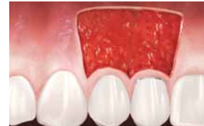
Approche chirurgicale pour la régénération du tissu kératinisé.