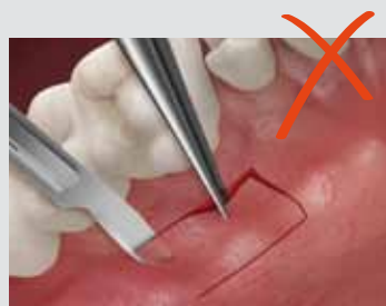
Geistlich Mucograft® permet d'éviter le prélèvement de tissu mou au palais