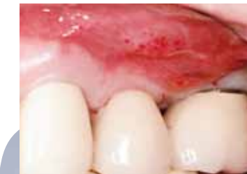
Situation initiale avant traitement (Dr A. Charles).

Moins de douleur, et retour à la normale plus rapide après l'intervention