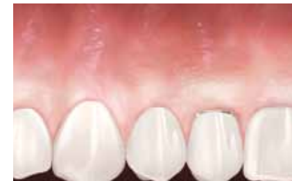
Restauration du tissu kératinisé 6 mois après la chirurgie (les résultats peuvent varier).

IMPORTANT : Il est essentiel traiter les infections existantes avant d'entreprendre le traitement chirurgical. Votre praticien saura vous conseiller sur les mesures convenant à votre problème.