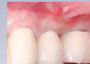
Résultat à 6 mois après régénération du tissu kératinisé avec Geistlich Mucograft® (Dr A. Charles).