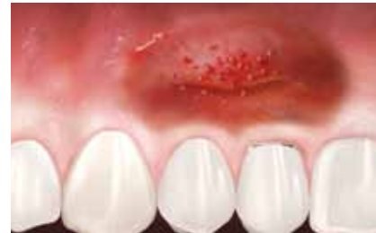
Situation initiale avec perte de tissu kératinisé.

La perte de tissu kératinisé peut souvent être traitée par une intervention chirurgicale appropriée. Votre dentiste vous recommandera un traitement adapté à votre cas.