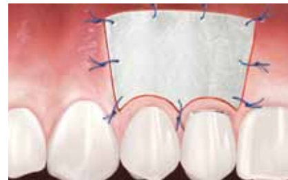
Geistlich Mucograft® en place.